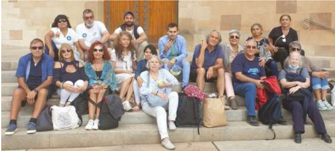
Al día siguiente en Montserrat-Barcelona