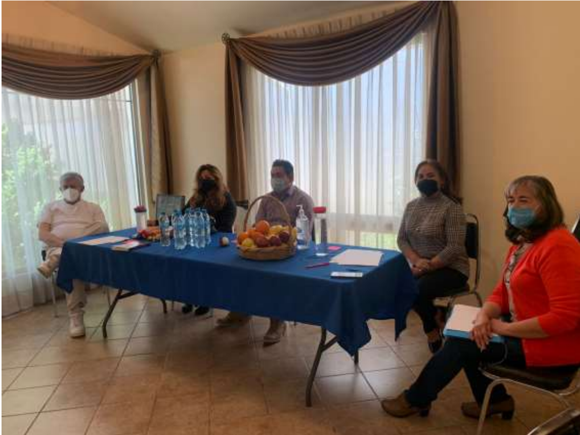
Casa Tseyor Saltillo. México. Jornada de Puertas abiertas en tiempos de contingencia.