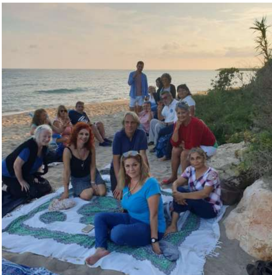
Playa Cabellos Blancos-Tarragona, momentos antes de la canalización

Los hermanos y hermanas de la Casa Tseyor Barcelona, y visitantes, están en la playa de los Cabellos Blancos, Tarragona, oyendo el rumor del mar. Se presentan y saludan a los asistentes a la Sala de la Casa Tseyor de Barcelona (Paltalk). Realizan el mantra de protección y se disponen a recibir un comunicado de los hermanos mayores. Previamente escuchamos la melodía de Gladiator , de Ennio Morricone, que Hada de Mascotas Pm puso en la sala. A la mañana siguiente, estaría prevista una excursión a la montaña de Montserrat-Barcelona.