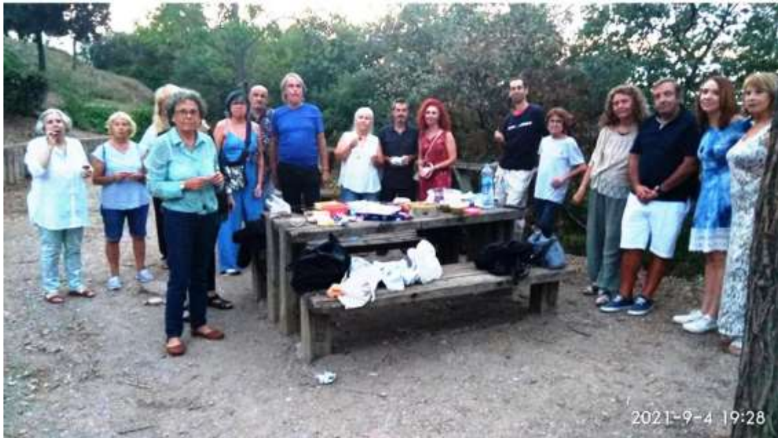
Merienda en la montaña sagrada Castell Ciuró